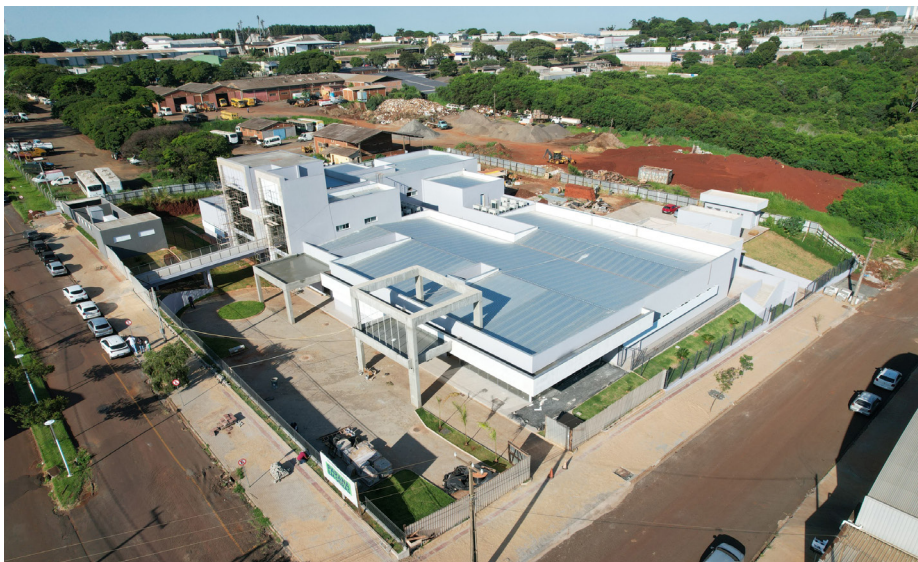
Novo Pronto Atendimento Municipal de Mandaguari: “mais conforto, menos tempo de espera”

A cidade conta com um PAM menor e a nova unidade foi projetada para atender ao aumento da demanda local. O novo espaço contará com estrutura especializada para adultos e crianças, além de um centro de diagnóstico por imagem e laboratórios de análises clínicas. No local, será possível realizar exames de tomografia, raio-X, ultrassonografia e eletrocardiograma. A estrutura também contará com uma central de distribuição de medicamentos. “Hoje, o Pronto Atendimento Municipal (PAM) já não consegue atender da melhor forma toda a demanda. Mandaguari cresceu nos últimos anos, e os atendimentos