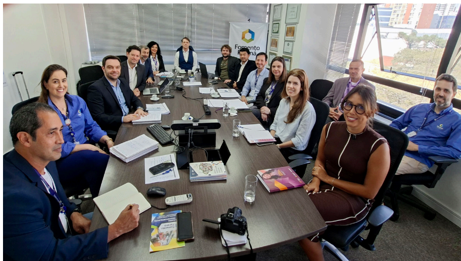
Missão do BID se reuniu com integrantes das áreas Administrativa e Financeira, Mercado, Planejamento, Presidência, Riscos e Agenda ASG para discutir detalhes do projeto de captação

As secretarias de Estado da Fazenda e do Planejamento apoiam o processo de captação dos recursos,