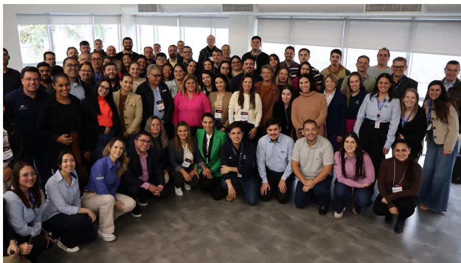
Encontro Regional de Agentes de Crédito realizado nas dependências do Sebrae/PR, em Curitiba, teve também a presença e participação de correspondentes de crédito

formam uma parceria fantástica, com equipes de trabalho extremamente dedicadas, que amam o que fazem. Por isso conseguimos apresentar à sociedade