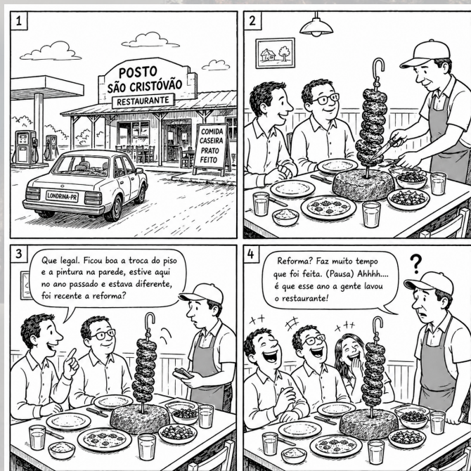
Arte produzida a partir do uso de recursos de inteligência artificial (Chat GPT - Dall E, versão gratuita)

Os três se olharam e não deu para evitar a gargalhada geral. O melhor foi a cara do garçom olhando pra eles sem entender nada da situação.