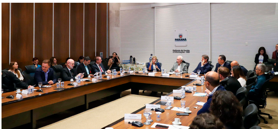
Evento no Palácio Iguaçu para reconhecer municípios com melhor desempenho no IdePAR

O Sistema de Financiamento aos Municípios – SFM, composto pela Secretaria das Cidades, Paranaidade e Fomento Paraná, conta agora com um sistema de classificação de riscos - Rating Municipal, chamado IdePAR – Índice de Desempenho Municipal dos Projetos Financiados. O indicador foi elaborado em parceria pelo Governo do Estado, por meio do SFM e o Instituto de Políticas Públicas e Desenvolvimento Sustentável, da Universidade Federal de Viçosa (MG) e compõe o Programa Paraná Urbano III, parcialmente financiado pelo BID (Banco Interamericano de Desenvolvimento). É considerada a performance dos municípios mutuários e do gestor da carteira de crédito, incluindo o desenvolvimento de sistema de monitoramento e Classificação de Riscos e Rating, utilizando o IdePAR como índice de desempenho quanto