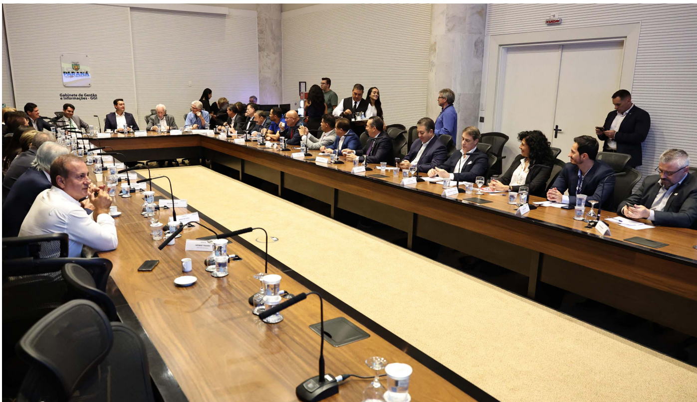
Em evento no Palácio Iguazu, a MBRF reafirmou o investimento de R$ 375 milhões, por meio do FIDC Agro Paraná