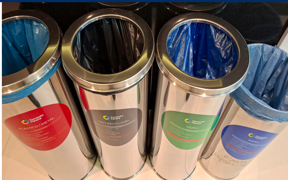
Novas lixeiras permitem separar cada tipo de resíduo para descarte mais adequado