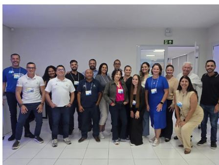
Fomento Paraná e Sebrae/PR realizaram uma série de Encontros Territoriais de Crédito no noroeste, passando por Cianorte (foto), Campo Mourão, Umuarama, Paranavaí e Umuarama.