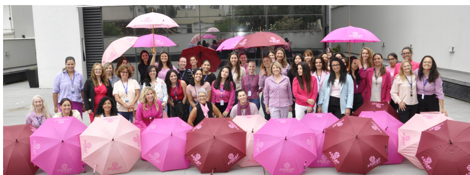
Colaboradoras da Fomento Paraná receberam uma pequena homenagem pelo Dia Internacional da Mulher, celebrado em 8 de março. Além de reforçar a importância do reconhecimento das mulheres no âmbito corporativo e familiar, a homenagem destaca a força, a competência e o protagonismo das mulheres que impulsionam o desenvolvimento do nosso Estado.

A, considerados muito acima da média. No ranking dos cinco municípios com maior efetividade no IdePAR Complexidade ficaram, em primeiro lugar, Godoy Moreira, com 58,01, seguido de Sabáudia (57,96), Amaporã (57,91), Cruzeiro do Iguaçu (57,72) e Cornélio Procópio (57,32).