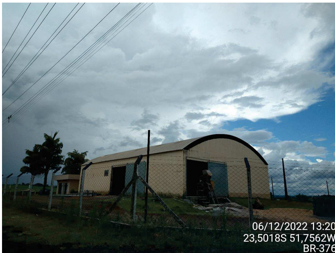
Vista da porção à direita do lote.