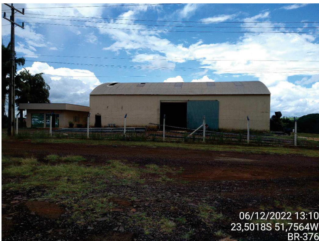
Vista frontal do imóvel.