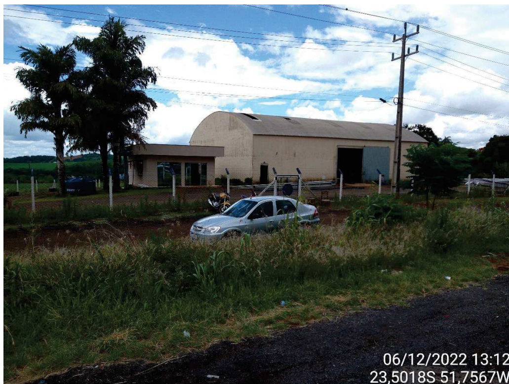
Vista da porção à esquerda do lote.