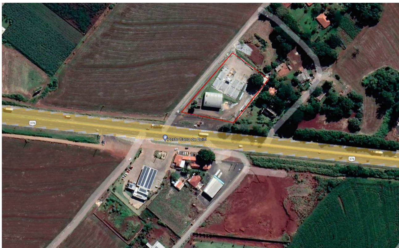
Figura 9.1. Vista aérea – Lote rural da matrícula 32.954 (Google Earth em 05/2022).